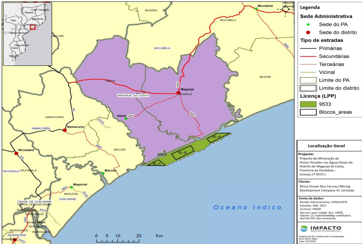
Figura 3 - Localização da área de concessão e dos blocos minerais a explorar dentro da área de concessão