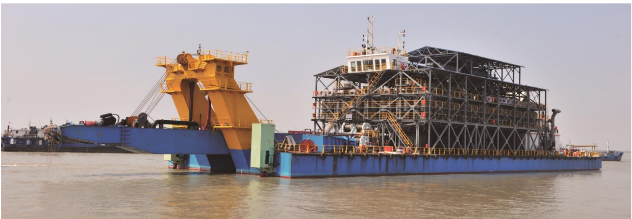
Figura 4 - Exemplo de barco de mineração utilizado na mineração de areias pesadas

Para a extracção e separação dos minerais será utilizado um barco de mineração, composto por duas divisões principais: a divisão da draga e a divisão da separação.